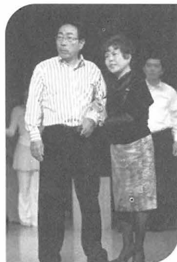
社長じゃなくて俳優だったんですか？ キタヤマさん

この企画の始動は約1年前からですから1年後の研究集会当日に我々経営者が直面している課題を検証しなければなりません。当時会員の多くの方は規制緩和、構造改革が進む中でこの先世の中がどのように変貌を遂げていくか不透明感や危