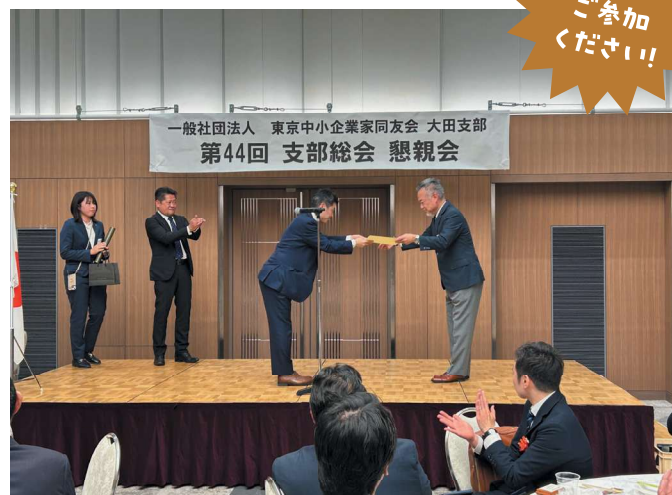
写真は2025年度支部総会のもの